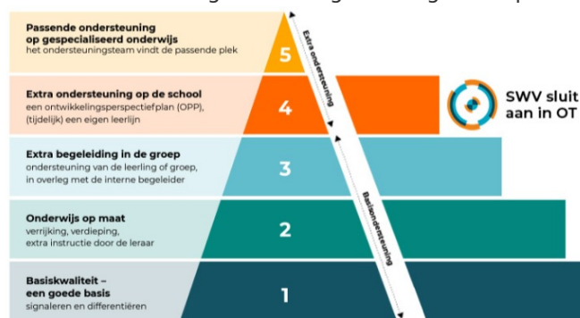
Piramide handelingsgericht werken (HGW)

De werkwijze heeft vijf niveaus van ondersteuning. Die wordt vaak met een piramide uitgebeeld. Hoe hoger het niveau, hoe meer ondersteuning en overleg er nodig is. De piramide ziet er zo uit: